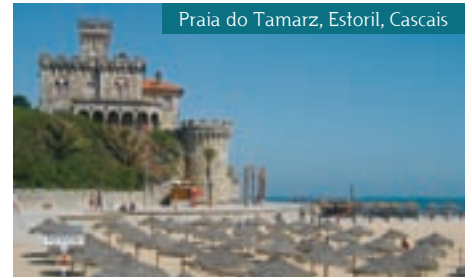
Praia do Tamariz, Estoril, Cascais