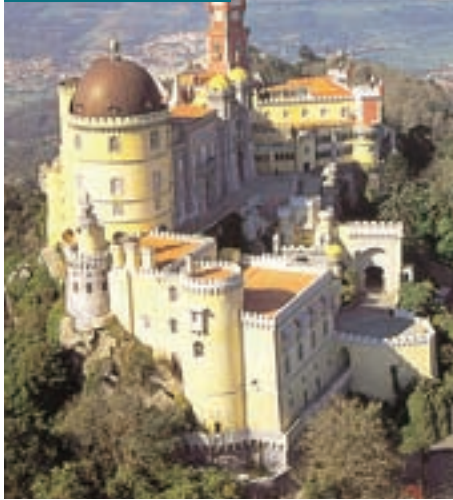
Palácio da Pena, Sintra