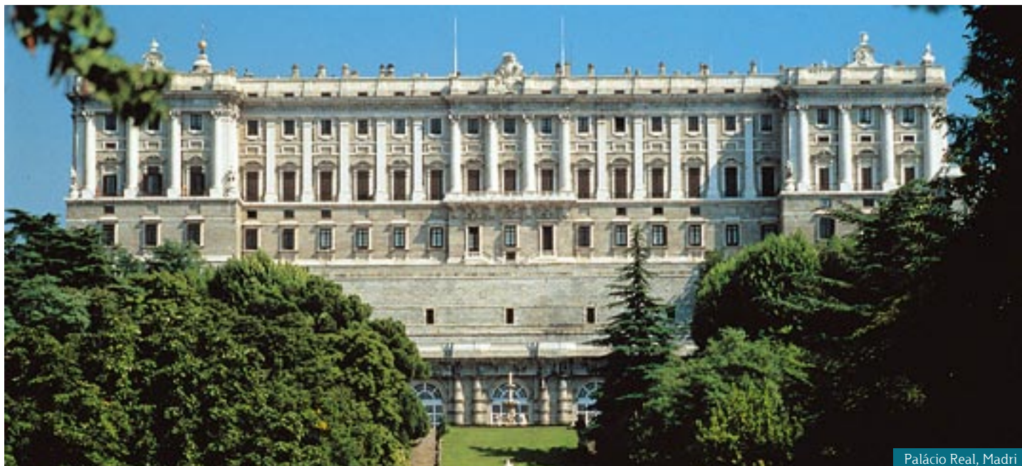
Palácio Real, Madri