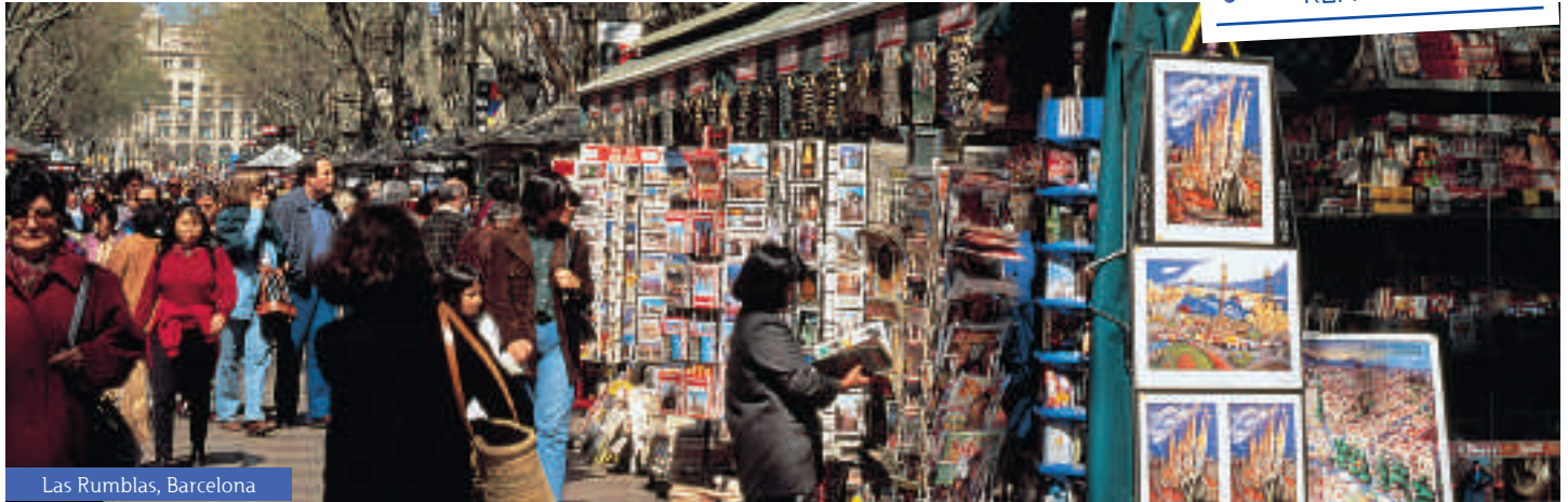
Las Rumbas, Barcelona