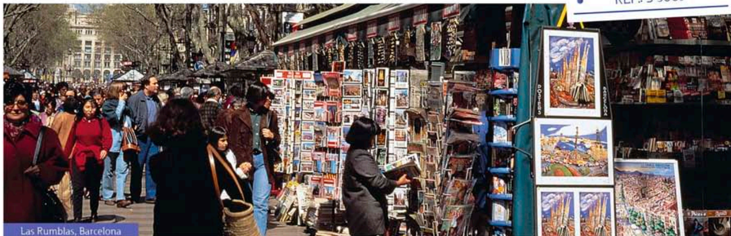
Las Rumbas, Barcelona