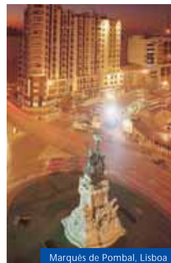
Marquês de Pombal, Lisboa